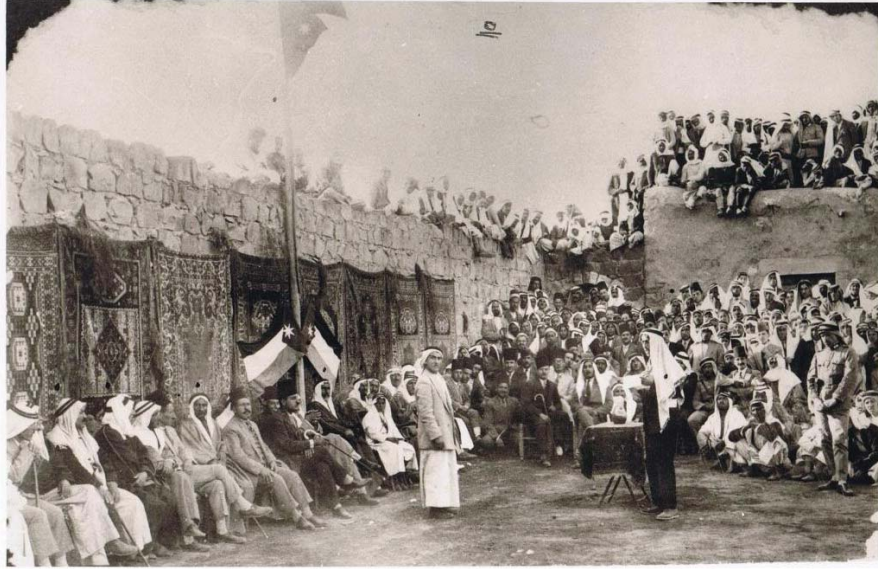
شاعر الأردن عرار يلقي قصيدة في المؤتمر الوطني الأول (١٩٢٨م)

ومن خلال ما سبق نستطيع أن نلمح المحاولة الجادة التي أظهرتها الدولة العثمانية بعد عام (١٨٦٤م) لتفادي ضعف الإدارة، وتعيين إداريين تكون مهمتهم الأولى حصر الموارد، وجمع الضرائب والمال للدولة (١) ، ومع دخول الدولة العثمانية الحرب العالمية الأولى في شهر تشرين الثاني عام (١٩١٤م)، بادرت بإعلان التعبئة العامة وطلبت من جميع طبقات المكلفين بالجندية أن يتقدموا للانخراط في صفوف الجيش، وبموجب قانون الخدمة العسكرية فقد أرسل شبان كثيرون من مختلف مناطق الأردن، ومن ضمنها منطقة عجلون وجرش وغيرها إلى هذه الحرب حيث لقي أكثرهم حتفه فمنهم من عاد، ومنهم من لم يرجع (٢) .