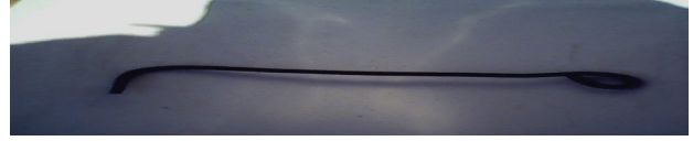
شكل رقم (٤) يوضح المسمار المستخدم في علاج اللوز

للعلاج بالكي مواضع يعرفها المعالجون بالكي، وهي مواضع محددة لا يجيدون عنها وهي غير مذكورة في الكتب العلمية، ولكنها متوارثة لدى المعالجين بالكي، فلكل مرض موضع كي محدد، كما يقول المعالج بالكي ”عندك مثلاً عرق النسا بنكوي قرب مفصل الفخذ من فوق عشان العرق ماسك الرجل من فوق أوله من عند مفصل الفخذ ده لحادة القدم، فأنا لازم أطقه من أوله، وعندك الصداع النصفي ده أجارك الله بيخلي البني آدم ماينامش ولا يعرف يمشي ولا يقعد بيكون نصف رأسه الشمال صداع مستمر وعينه الشمال مرغللة، يعني بيكون عنده ضغط عالي مآثر على رأسه وعينه، وده بنكويه فوق الودن الشمال، عشان العرق إللي خارج من الراس بدايته فوق الودن الشمال، واللوز بتكوي فوق الودن اليمين والودن الشمال عشان العرق إللي رايح لها فوق الودن اليمين والودن الشمال، وفتق الخصيتين بنكويه فوق العرق إللي واصل للخصيتين، الكوي دائماً لازم ناخذ العرق من أوله يعني بنشوف المرض ده أول العرق إللي واصله فين ونطقه“ (١٧).