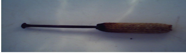
شكل رقم (٢) يوضح المسامير المستخدمة لعلاج عرق النسا