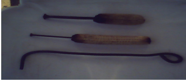
شكل رقم (١) يوضح أشكال المسامير المستخدمة في الكي

توجد أدوات خاصة للعلاج بالكي يصنعها المعالج بالكي بنفسه، وهى عبارة عن مسامير من الحديد بمقاسات مختلفة ويوضع في عازل عن الحرارة كقطعة من الخشب أي شيء من البيئة كبقايا ثمرة الذرة، وقطعة من حديد التسليح بطول خمسين سنتيمتر تقريباً.