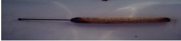
شكل رقم (٣) يوضح المسامير المستخدمة لعلاج الصداع